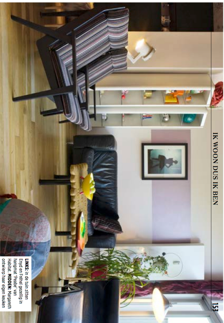
IK WOON DUS IK BEN